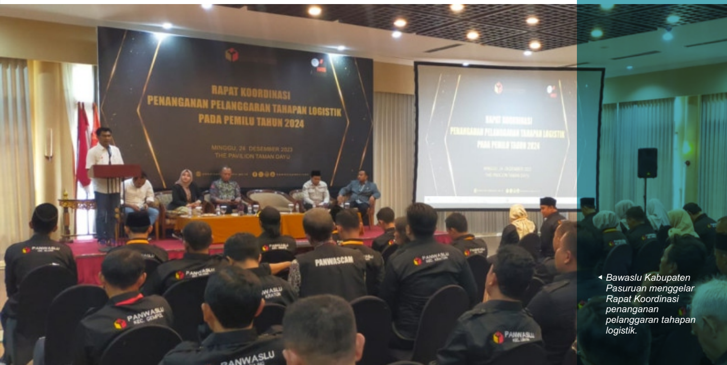
◀ Bawaslu Kabupaten Pasuruan menggelar Rapat Koordinasi penanganan pelanggaran tahapan logistik.