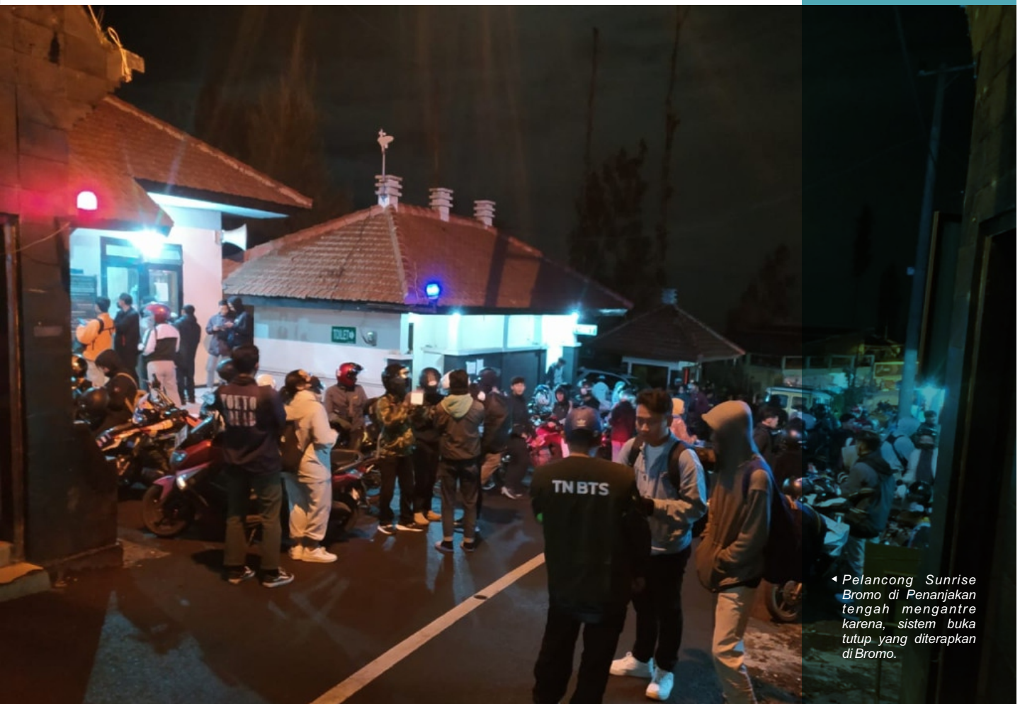
◀ Pelancong Sunrise Bromo di Penanjakan tengah mengantri karena, sistem buka tutup yang diterapkan di Bromo.