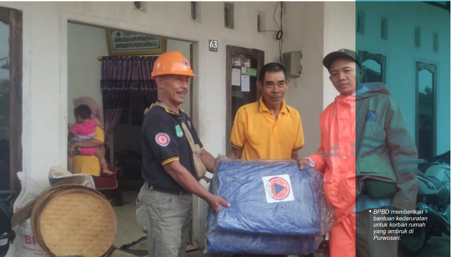
◀ BPBD memberikan bantuan kedaruratan untuk korban rumah yang ambruk di Purwosari.