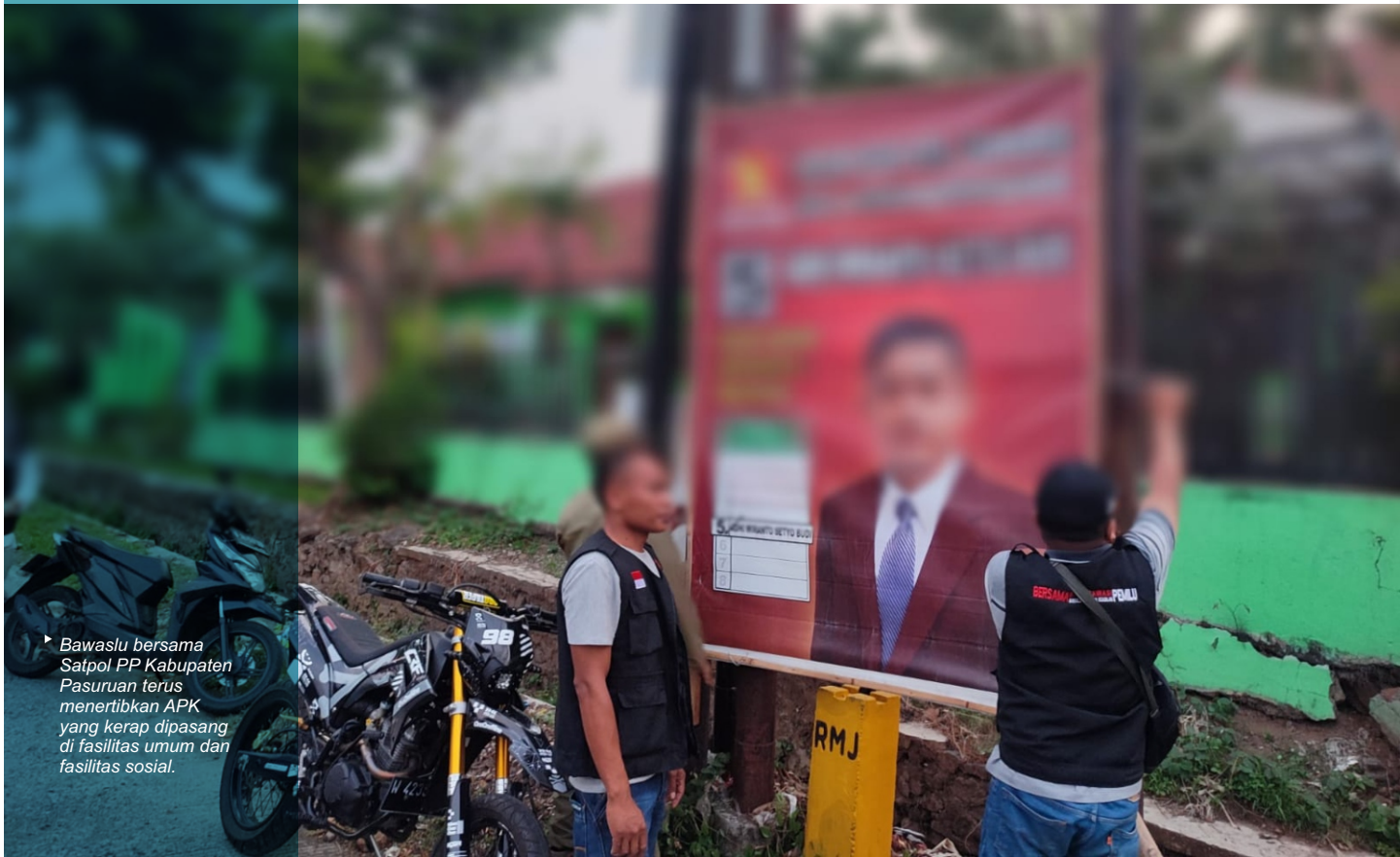
► Bawaslu bersama Satpol PP Kabupaten Pasuruan terus menertibkan APK yang kerap dipasang di fasilitas umum dan fasilitas sosial.