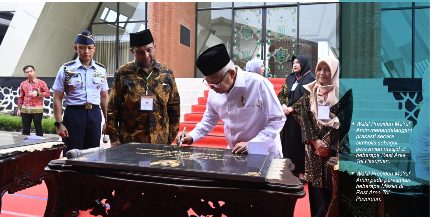
Wakil Presiden Ma'ruf Amin menandatangani prasasti secara simbolis sebagai peresmian masjid di beberapa Rest Area Tol Pasuruan. Wakil Presiden Ma'ruf Amin pada peresmian beberapa Masjid di Rest Area Tol Pasuruan.