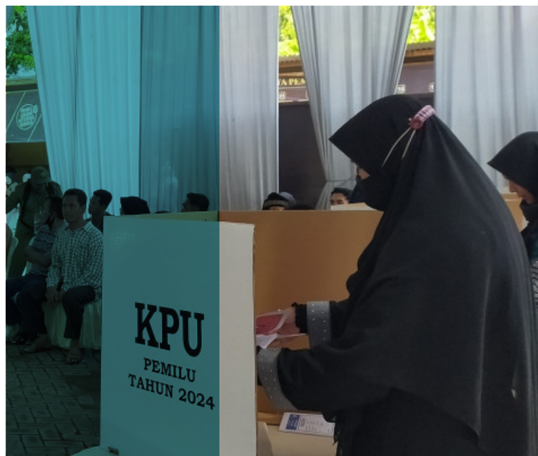
Komisi Pemilihan Umum Kabupaten Pasuruan menggelar Simulasi Pemungutan Suara Pemilu Serentak 2024.