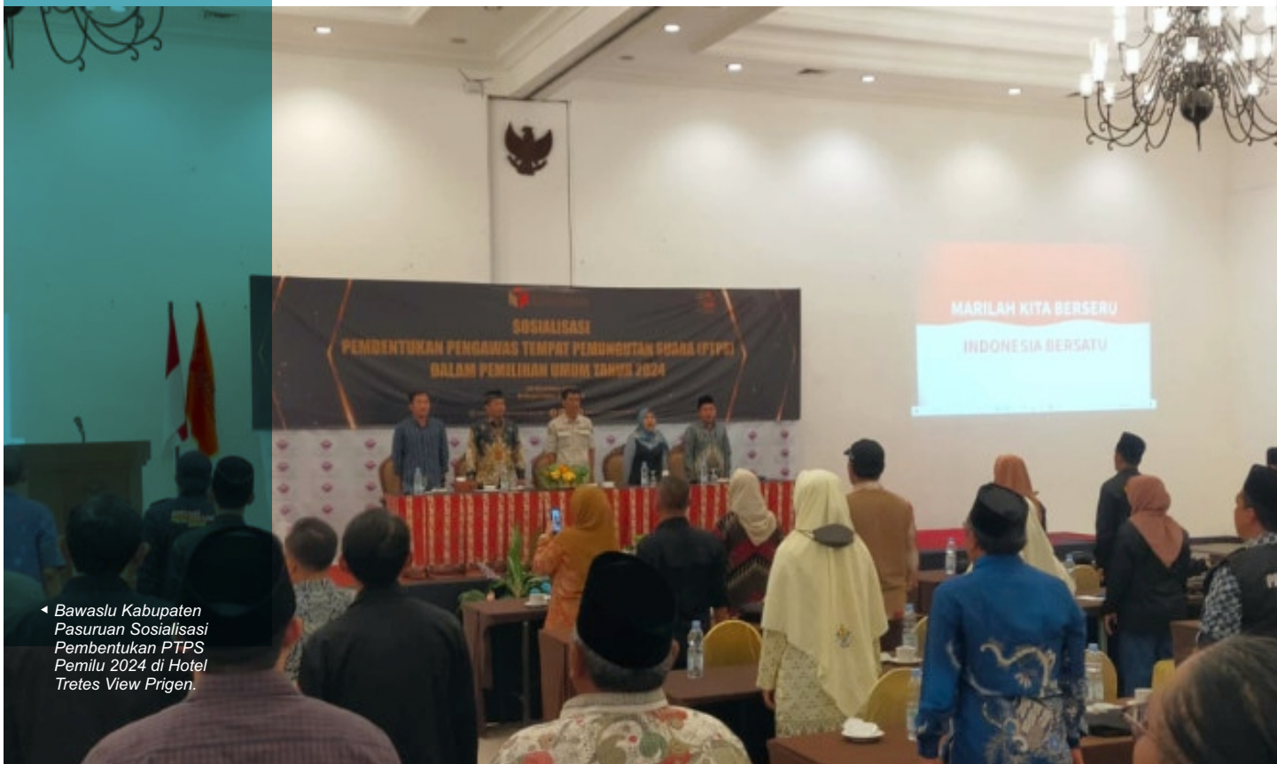
◀ Bawaslu Kabupaten Pasuruan Sosialisasi Pembentukan PTPS Pemilu 2024 di Hotel Tretes View Prigen.