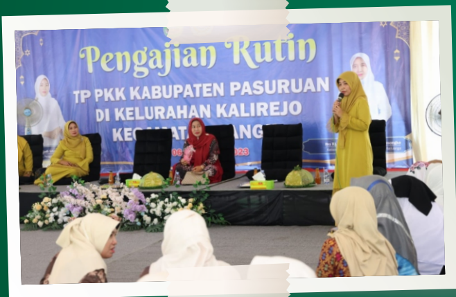
Pengajian Rutin TP-PKK