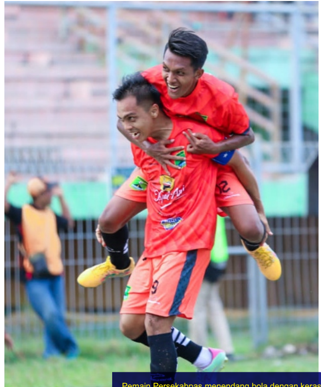
Pemain Persekabpas menendang bola dengan keras.

"Saya hanya punya niat satu. Menyelamatkan Persekabpas. Makanya kenapa saya menawarkan diri untuk menjadi Ketua Askab atau Manajer PSSI Kabupaten Pasuruan, karena kalau tidak, dilanjutkan nanti malah dibekukan," ungkapnya.