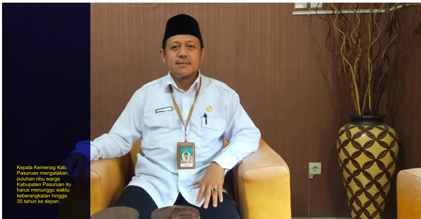
Kepala Kemenag Kab. Pasuruan mengatakan, puluhan ribu warga Kabupaten Pasuruan itu harus menunggu waktu keberangkatan hingga 35 tahun ke depan.

"Ini terus bertambah, karena rata-rata per bulan lebih dari 100 orang yang daftar haji. Ini menunjukkan tren yang baik untuk orang melaksanakan ibadah wajib bagi muslim yang mampu," kata Syaikhul saat ditemui di ruangannya, Senin (04/12/2023). (emil)