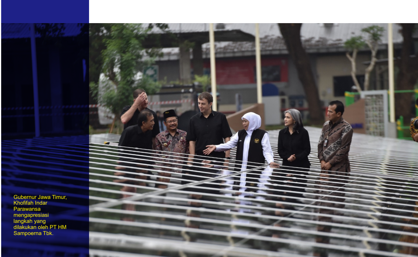
Gubernur Jawa Timur, Khofifah Indar Parawansa mengapresiasi langkah yang dilakukan oleh PT HM Sampoerna Tbk.