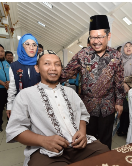
Pj Bupati menyambut hangat kehadiran para penyandang disabilitas.