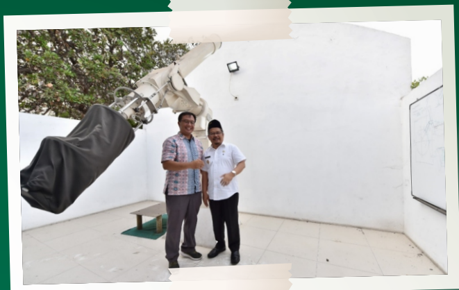
Visitasi Kantor Lapan