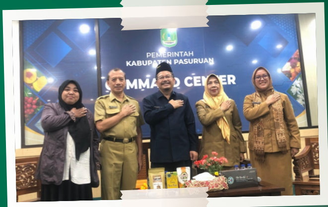
Pj Bupati Talkshow