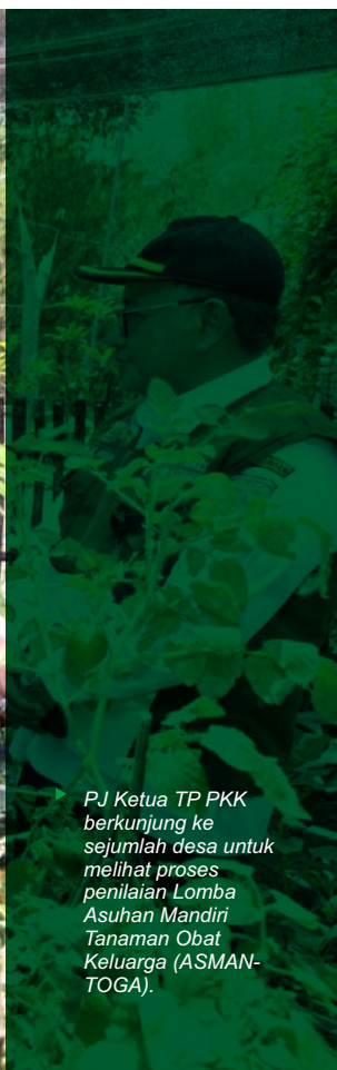
Pj Ketua TP PKK berkunjung ke sejumlah desa untuk melihat proses penilaian Lomba Asuhan Mandiri Tanaman Obat Keluarga (ASMAN-TOGA).