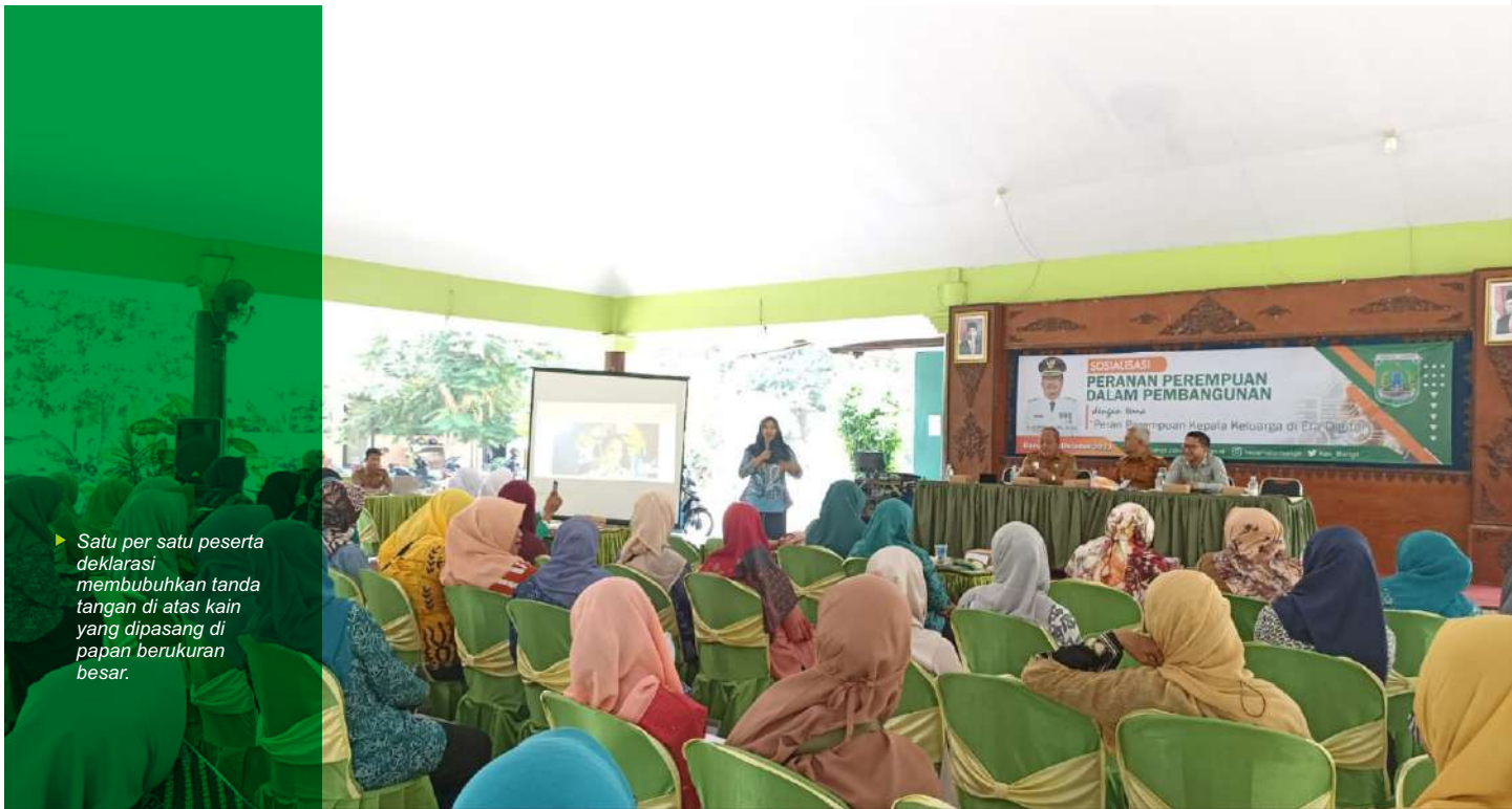
► Satu per satu peserta deklarasi membubuhkan tanda tangan di atas kain yang dipasang di papan berukuran besar.