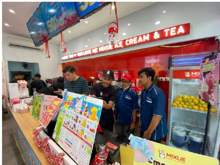
► Pemungutan pajak daerah di café/resto.

"Kami optimis target akan terpenuhi sebelum akhir tahun. Karena semua tim semangat untuk melakukan banyak cara,