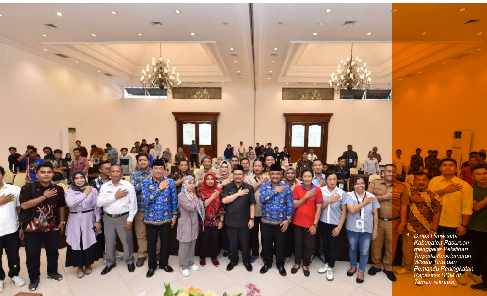
▶ Dinas Pariwisata Kabupaten Pasuruan menggelar Pelatihan Terpadu Keselamatan Wisata Tirta dan Pemandu Peningkatan Kapasitas SDM di Taman rekreasi.

"Ya sudah pasti. Penanganan kecelakaan bagian dari pelayanan yang harus dimiliki setiap tempat wisata. Harus diperhatikan betul supaya pengunjung terpesona dan suka berkunjung ke tempat wisata itu sendiri," akunya. (emil)