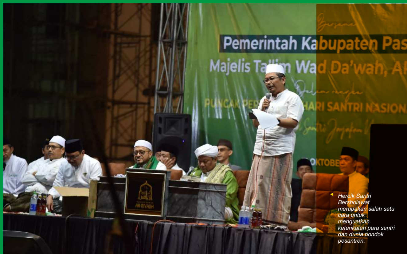
Heroik Santri Bersholawat merupakan salah satu cara untuk menguatkan keterikatan para santri dan dunia pondok pesantren.

"Mudah-mudahan kita menjadi pribadi yang senantiasa bersholawat kepada Junjungan Nabi Besar Muhammad SAW. Kita jadi pengikut Nabi Muhammad, selamat dunia akhirat," ajaknya. (emil)