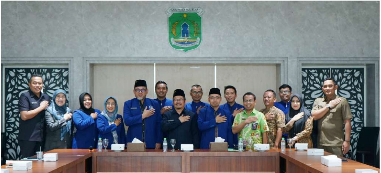
► Pj Bupati Pasuruan Minta KORMI Gencarkan Literasi Digital Jadi Cara Populerkan Oltrad.