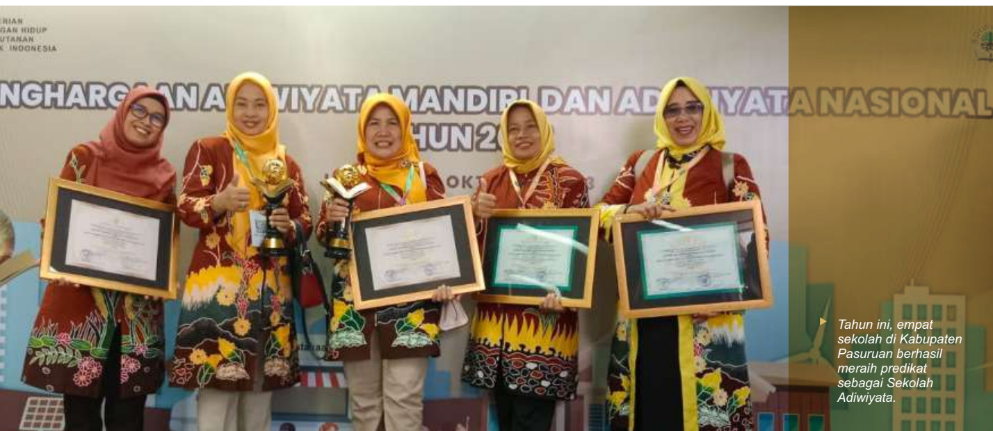
Tahun ini, empat sekolah di Kabupaten Pasuruan berhasil meraih predikat sebagai Sekolah Adiwiyata.