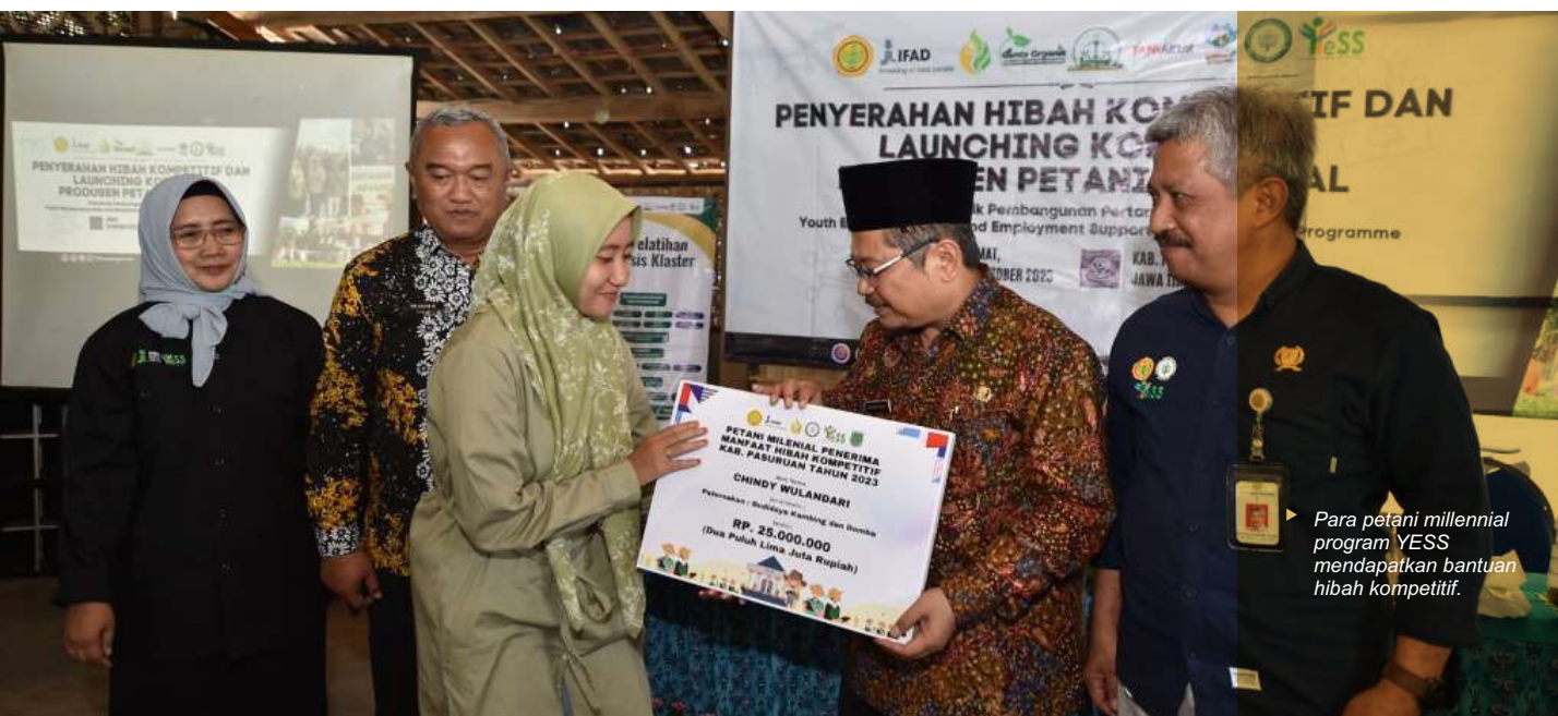
Para petani milenial program YESS mendapatkan bantuan hibah kompetitif.