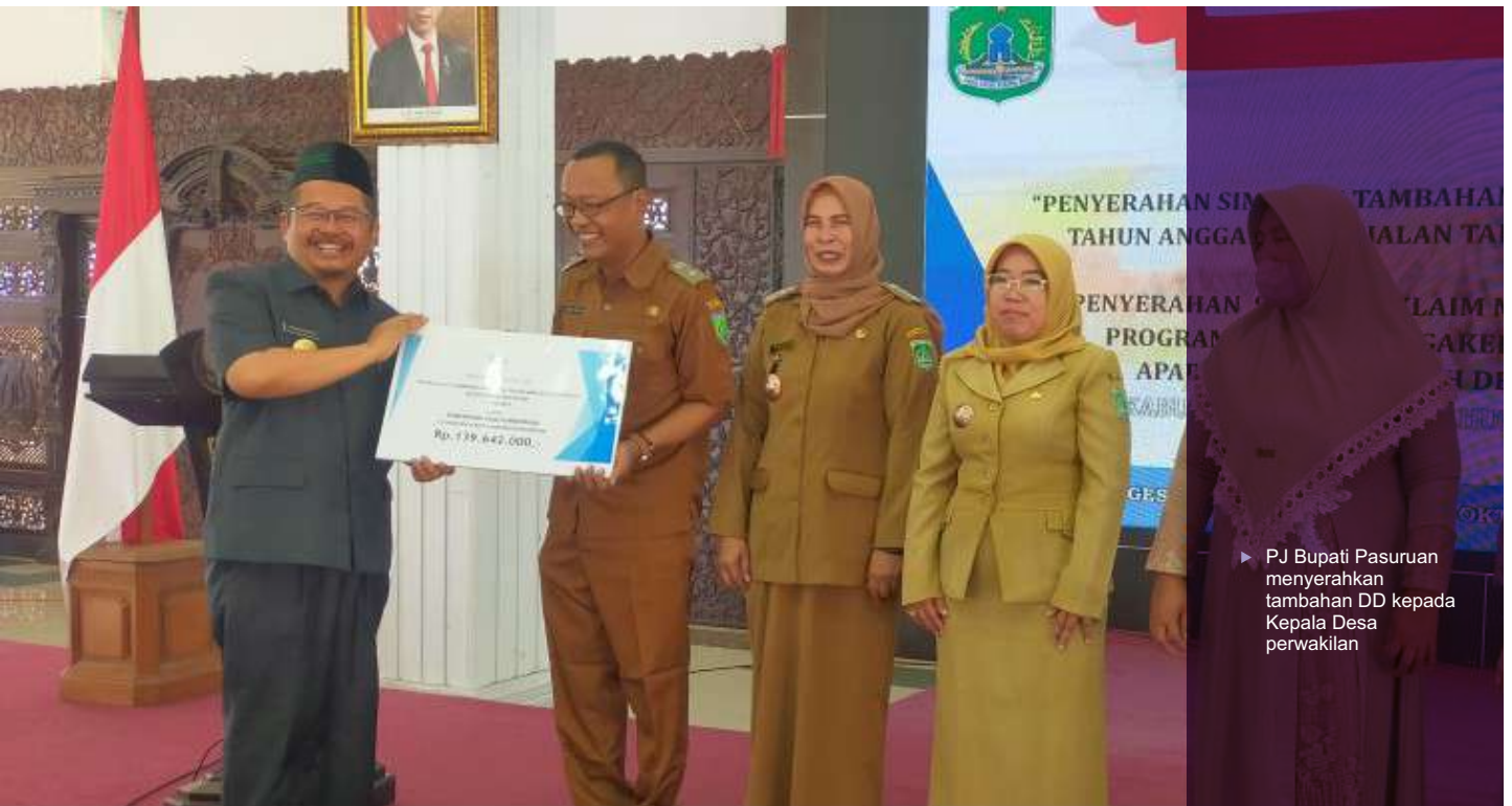
► Pj Bupati Pasuruan menyerahkan tambahan DD kepada Kepala Desa perwakilan

Kementerian Keuangan memberikan tambahan dana desa (DD) untuk 65 desa di Kabupaten Pasuruan.