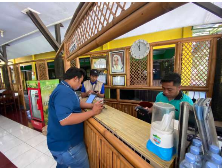
► Capaian realisasi pajak daerah sejak 2020 hingga 2023 terus meningkat.

Berdasarkan data dari Badan Pengelolaan Keuangan dan Pendapatan Daerah (BPKPD) Kabupaten Pasuruan, capaian