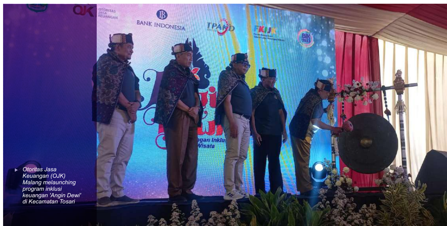
► Otoritas Jasa Keuangan (OJK) Malang melaunching program inklusi keuangan 'Angin Dewi' di Kecamatan Tosari

"ekosistem keuangan inklusif ini membantu masyarakat Tosari afar terbiasa dengan transaksi digital, karena pola sekarang era 4.0 harus terbiasa transaksi non tunai," pungkasnya. (emil)