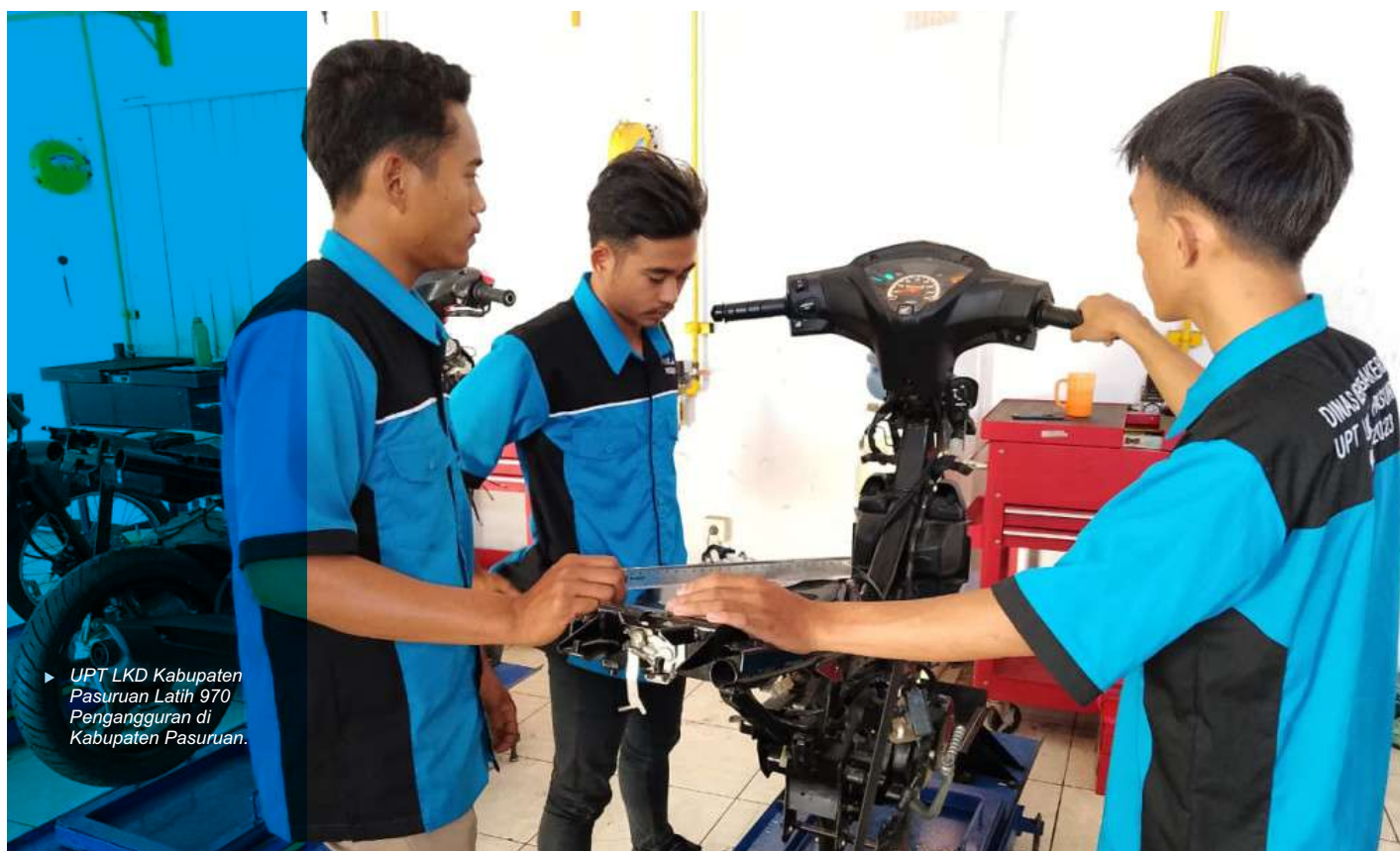
► UPT LKD Kabupaten Pasuruan Latih 970 Pengangguran di Kabupaten Pasuruan.

"Makanya kami datangkan instruktur yang berpengalaman supaya membagikan ilmunya. Ketika sudah selesai, peserta