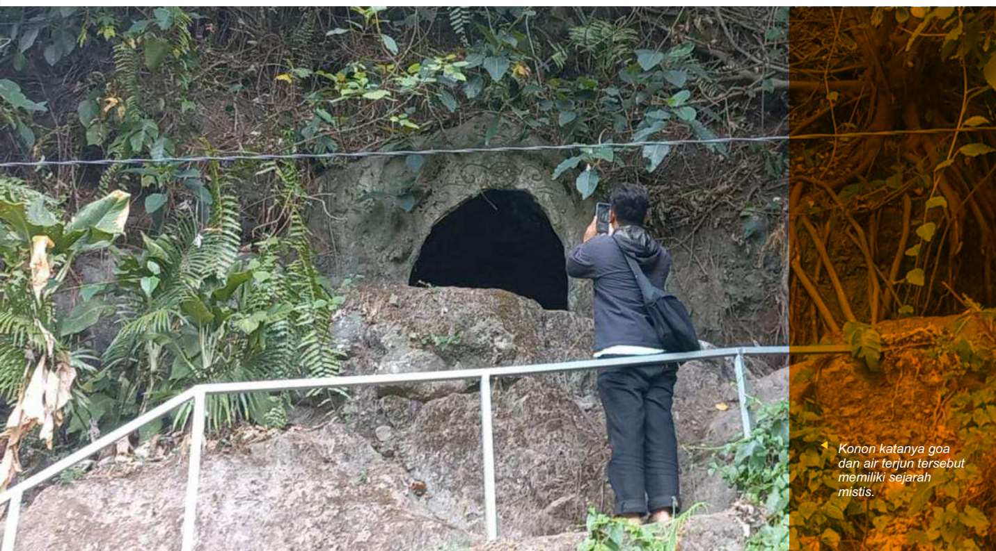
Konon katanya goa dan air terjun tersebut memiliki sejarah mistis.

"Dinding gua sekelilingnya berupa bebatuan, pada permukaan atasnya terdapat rembesan air. Untuk masuk ke dalam, aman," terang Doni, anggota POKDARWIS sekaligus pemuda asal desa setempat. (emil)