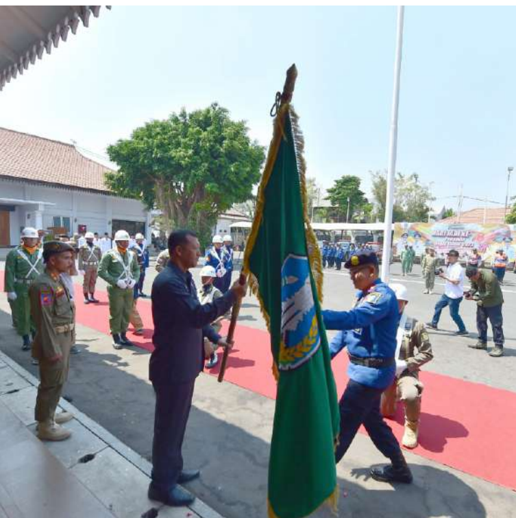
► Upacara dalam rangka menyambut datangnya Kirab Pataka Jer Basuki Mawa Beya.

Pemerintah Kabupaten Pasuruan Menggelar Upacara dalam rangka menyambut datangnya Kirab Pataka Jer Basuki Mawa Beya, Senin (09/10/2023) pagi