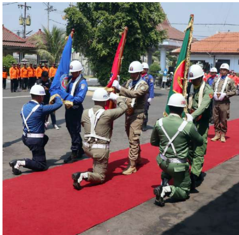
► Upacara penyerahan Pataka dari Kasat Pol PP Kota Probolinggo kepada Sekretaris Daerah Kabupaten Pasuruan.

"Kami libatkan banyak UMKM agar mereka bisa meramaikan Hari Jadi Provinsi Jawa Timur tahun ini," tutupnya. (emil)