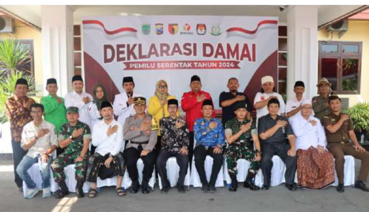
Kominfo Kabupaten Pasuruan

indikasi yang lainnya. Oleh karenanya, panitia wajib mengacu seluruh tugas dan kewenangannya pada Peraturan Perundang-Undangan.