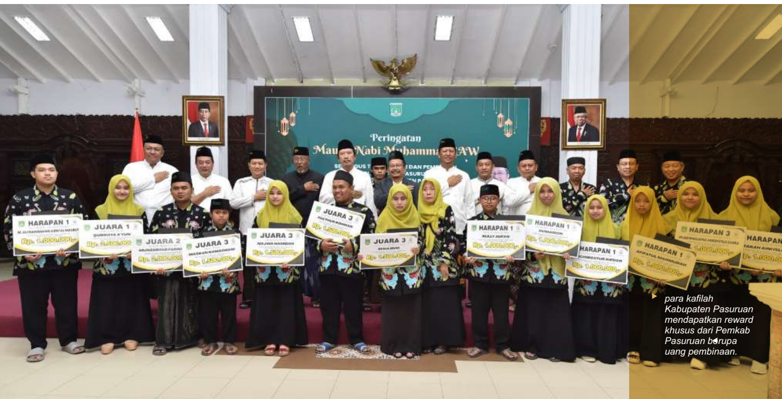
para kafilah Kabupaten Pasuruan mendapatkan reward khusus dari Pemkab Pasuruan berupa uang pembinaan.