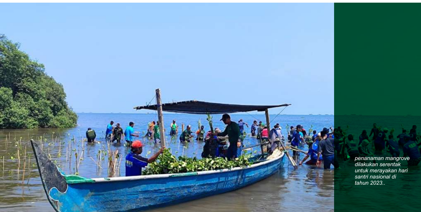
penanaman mangrove dilakukan serentak untuk merayakan hari santri nasional di tahun 2023..