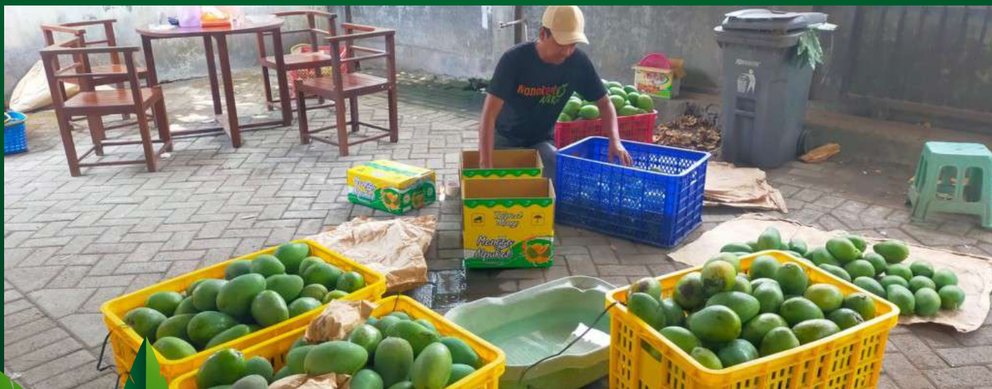
► Petani manga alpukat sedang panen raya melimpah.