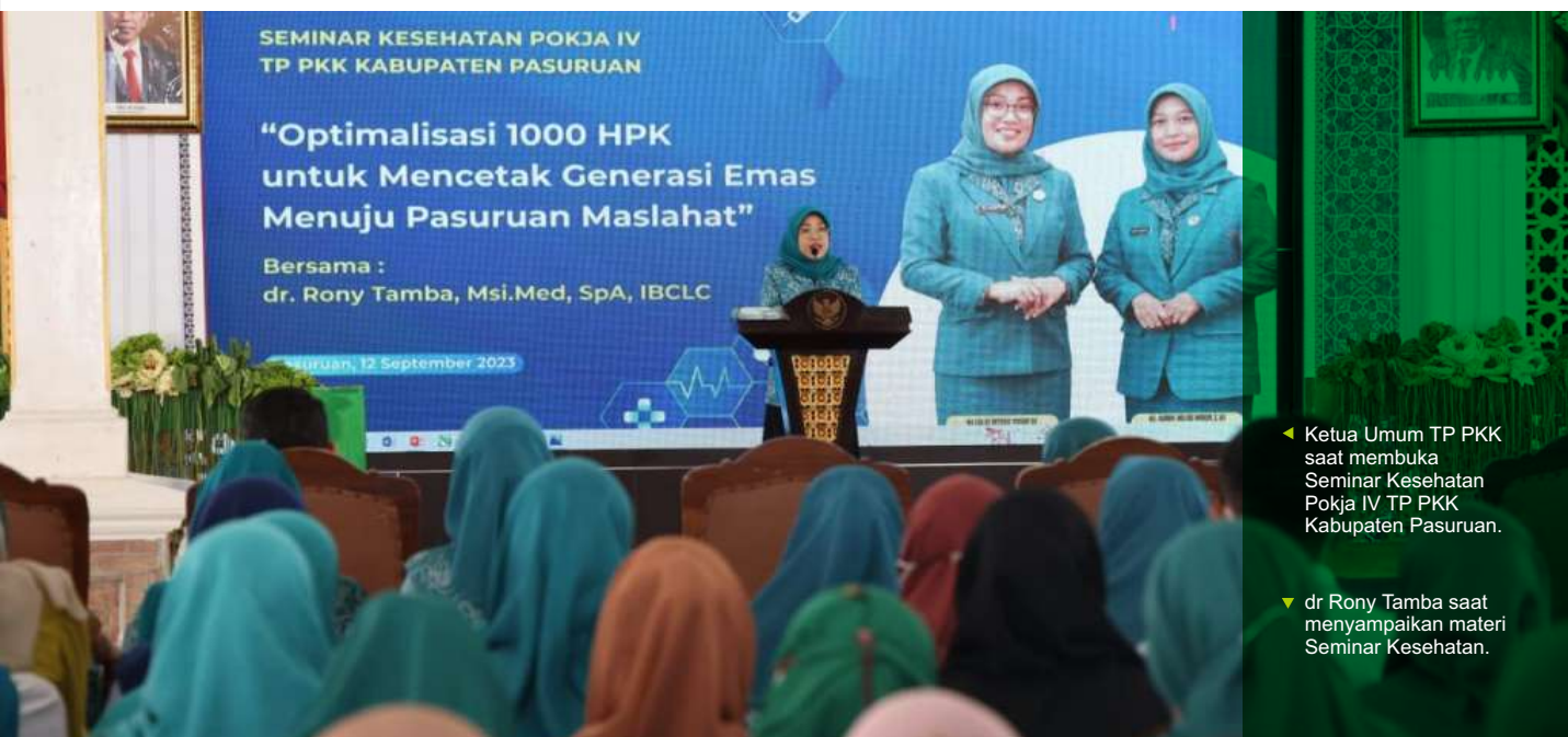
▼ Ketua Umum TP PKK saat membuka Seminar Kesehatan Pokja IV TP PKK Kabupaten Pasuruan.

"Sehingga kita bisa lebih mengerti lagi anak-anak agar bisa