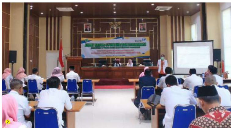
1 DP3APKB Kabupaten Pasuruan melakukan audit stunting dan diseminasi semester 1 tahun 2023 di Auditorium Mpu Sindok Graha Maslahat.