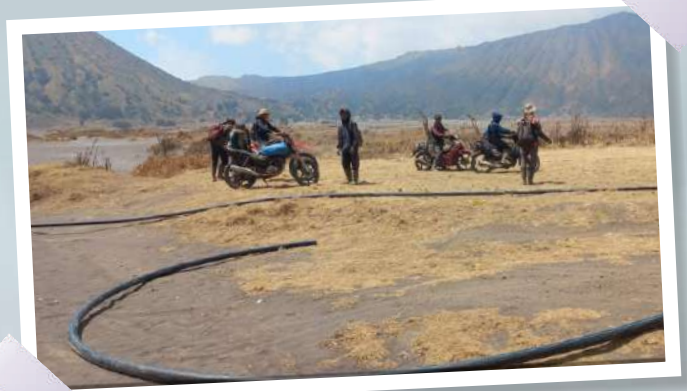
Antusiasme Warga Tosari memperbaiki pipa pasca kebakaran Bromo.

"Pipanya hasil swadaya warga masyarakat setempat," pungkasnya. (emil)