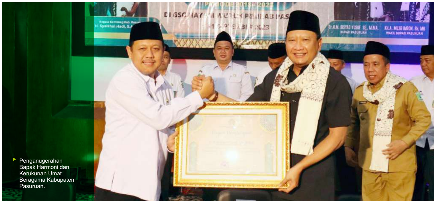
► Penganugerahan Bapak Harmoni dan Kerukunan Umat Beragama Kabupaten Pasuruan.