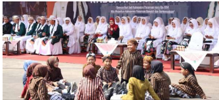
► Permainan tradisional dari para pelajar SD di Kabupaten Pasuruan dalam rangka memeriahkan Hari Jadi Pemerintah Kabupaten Pasuruan.