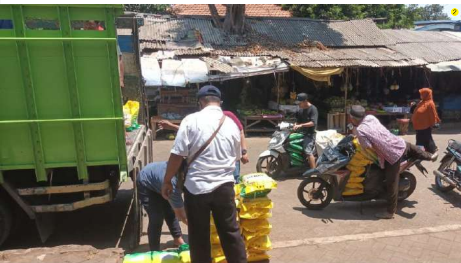
1 Pedagang mengantrre membeli beras premium kemasan 5 kg.

"Kami minta untuk masyarakat tidak panik. Karena pemerintah akan terus hadir untuk membantu menstabilkan harga beras sampai betul-betul aman," tegasnya. (emil)