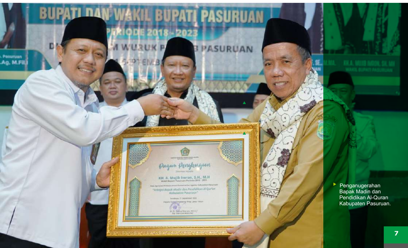
► Penganugerahan Bapak Madin dan Pendidikan Al-Quran Kabupaten Pasuruan.

"Wak Mukidin harus dilanjutkan di tahun-tahun mendatang, karena pendidikan diniyah menjadi dasar untuk anak bisa tahu tentang Al Qur'an dan menerapkan nilai kehidupan yang ada di dalamnya," harapnya. (emil)