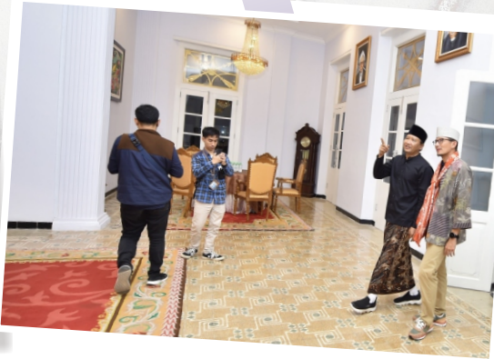
Mas Menteri dan Gus Bupati