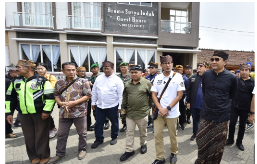
▲ Menparekraf Sandiaga Uno didampingi Bupati Irsyad dalam rangka melihat secara langsung Desa Wisata Edelweiss Wonokitri sebagai 75 desa wisata terbaik di Indonesia yang masuk dalam Anugerah Desa Wisata Indonesia.