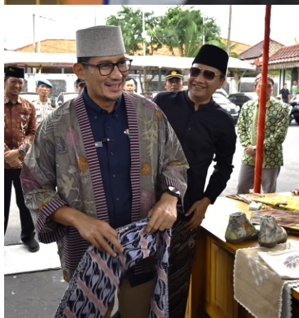
▲ Mas Menteri Sandi Uno dibuat kagum dengan kualitas produk UKM Kabupaten Pasuruan.

Kreatif (KaTa Kreatif) Indonesia. Workshop ini dilaksanakan oleh Kementerian Pariwisata dan Ekonomi Kreatif dan digelar di Pendopo Nyawiji Ngesti Wenganing Gusti, Minggu (16/04/2023) sore.