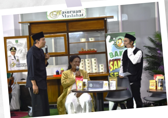
Komedi Dan Dakwah