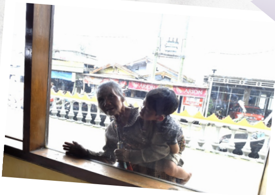
Di Balik Jendela