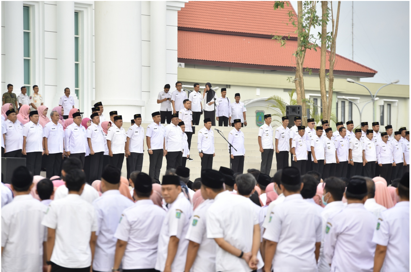
Apel pagi sekaligus Halal Bihalal Bupati dan Wakil Bupati Pasuruan di Halaman Gedung Maslahat.