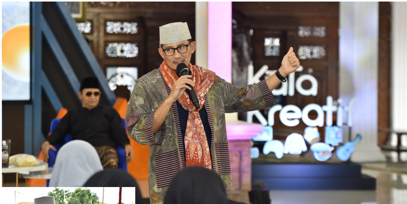
▲ Menparekraf Sandiaga Uno memberikan sambutan dalam Workshop Peningkatan Inovasi dan Kewirausahaan Kabupaten Kota Kreatif (KaTa Kreatif) Indonesia.

juga terus mendorong penguatan ekosistem ekonomi kreatif secara lebih komprehensif di Kabupaten Pasuruan melalui kegiatan jejaring kabupaten/kota kreatif. Sehingga dapat mengemba-