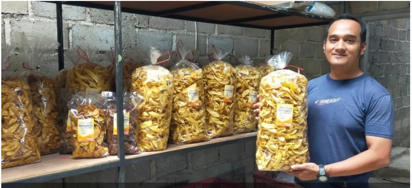
Muhammad Sidiq yang mampu raup omzet jutaan rupiah dari pisang cavendish sortiran menjadi kripik pisang