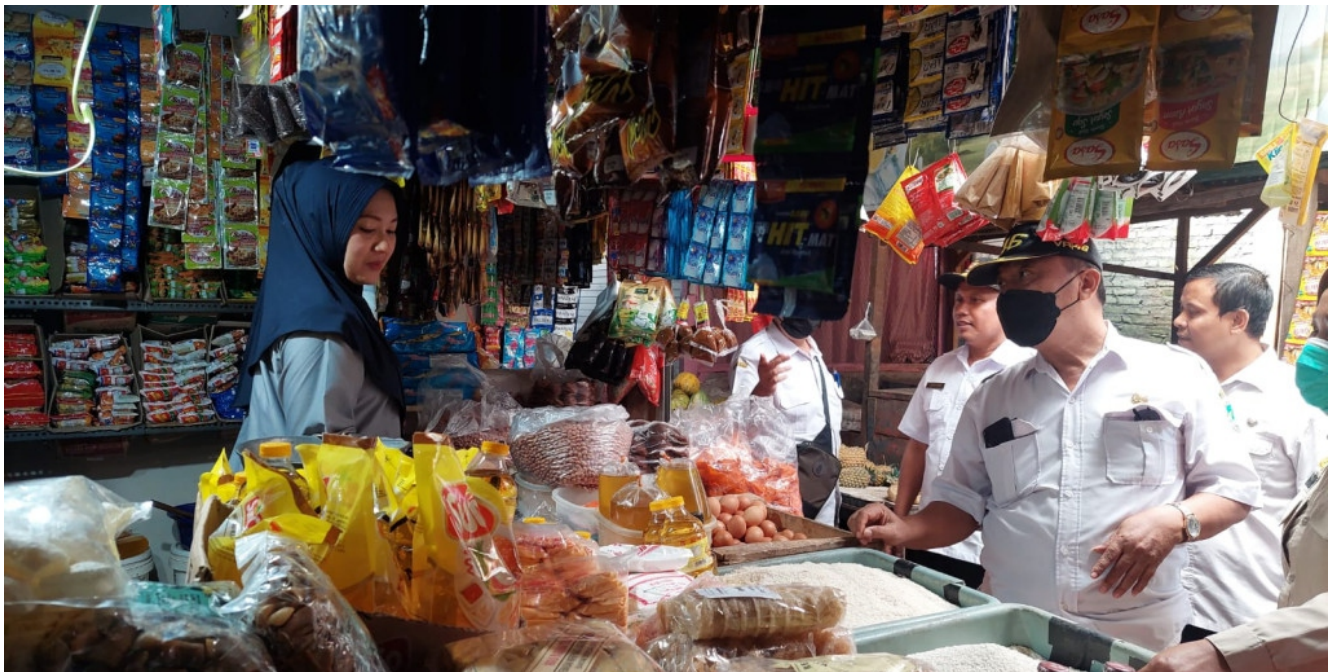
Disperindag bersama Satpol PP, Bagian Perekonomian serta Polres Pasuruan mengunjungi dua pasar daerah yakni Pasar Bangil dan Pasar Pandaan.