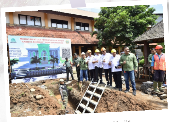
Persiapan Pembangunan Masjid