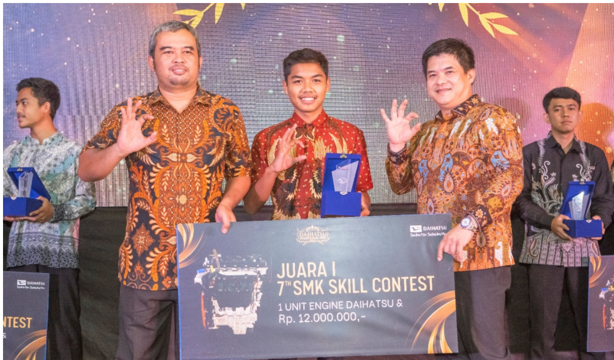
Bravo!!! Perwakilan dari SMKN 1 Purwosari dalam Daihatsu SMK Skill Contest ketujuh tingkat nasional yang menyabet juara ke I