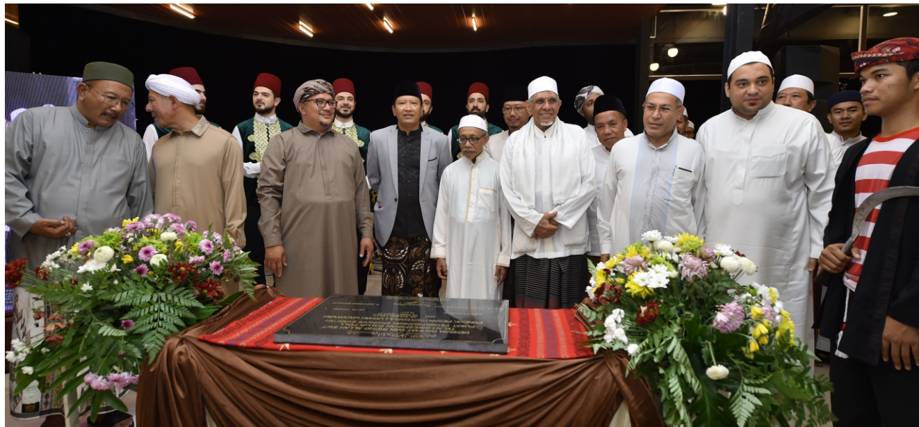
Bupati Irsyad Yusuf mengapresiasi kehadiran pusat perbelanjaan yang dibangun di lingkungan Pondok Pesantren (Ponpes) Darullughah Wadda'wah (Dalwa) Putra Kampus I.

"Bahwa konsep beliau luar biasa memberikan contoh. Disisi lain, ini sebenarnya fasilitas santri, fasilitas dari Pesantren yang memberikan nilai lebih kepada santri. Karena mereka pada akhirnya tidak akan kemana-mana jika ingin belanja. Cukup disini saja,"