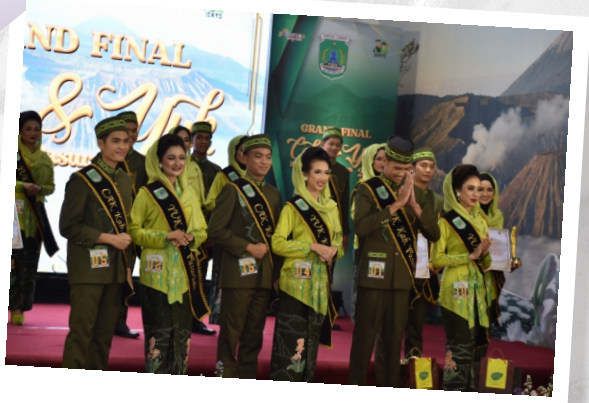
Cak & Ning Kabupaten Pasuruan 2023