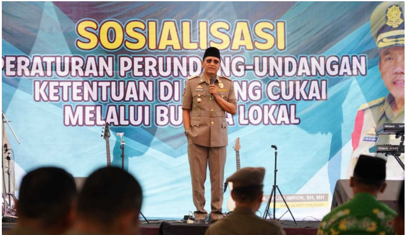
Dibutuhkan kolaborasi dari Bea Cukai dan Pemerintah Kabupaten Pasuruan dalam menekan peredaran rokok tanpa pita cukai.